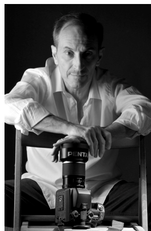
Dal libro "Dualismi"

Tutte queste immagini hanno qualcosa in comune, che segue un unico percorso: la costruzione mentale, la composizione nel mirino, la scelta della luce; il frutto di una sapiente elaborazione, unito alla sensibilità di chi osserva. Come spesso ricorda l'autore (citando i suoi maestri) "fotografare vuol dire disegnare con la luce" e "allineare la testa, l'occhio e il cuore".