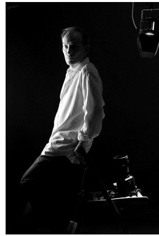
Prima pagina del libro

Alla base di questo percorso c'è un concetto ben preciso: la fotografia nasce da un'idea, che porta alla sua costruzione mentale, alla composizione nel mirino, alla scelta della luce; e infine c'è lo scatto, che non sarà casuale, ma frutto di una sapiente elaborazione.